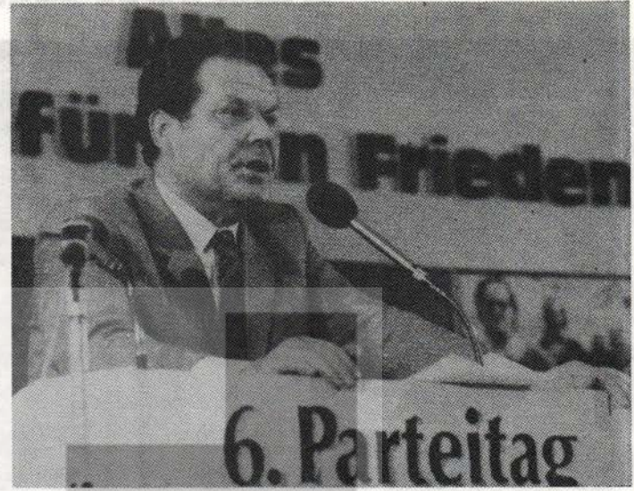
HERBERT MIES 6. KONGRENİN KAPANIŞ KONUŞMASINI YAPARKEN

Alman Komünist Partisi DKP'nin 6. Kongresi 29-31 Mayıs tarihlerinde "Herşey için" parolası altında Hannover'de toplandı. Sosyalist ve kapitalist ülkelerdeki komünist ve işçi partileriyle birçok ulusal kurtuluş hareketi temsilcilerinin katıldıkları kongre, coşkun bir hava içerisinde geçmiş; kongre işçi sınıfı enternasyonalizminin somutlandığı bir platform niteliğine bürünmüştür.